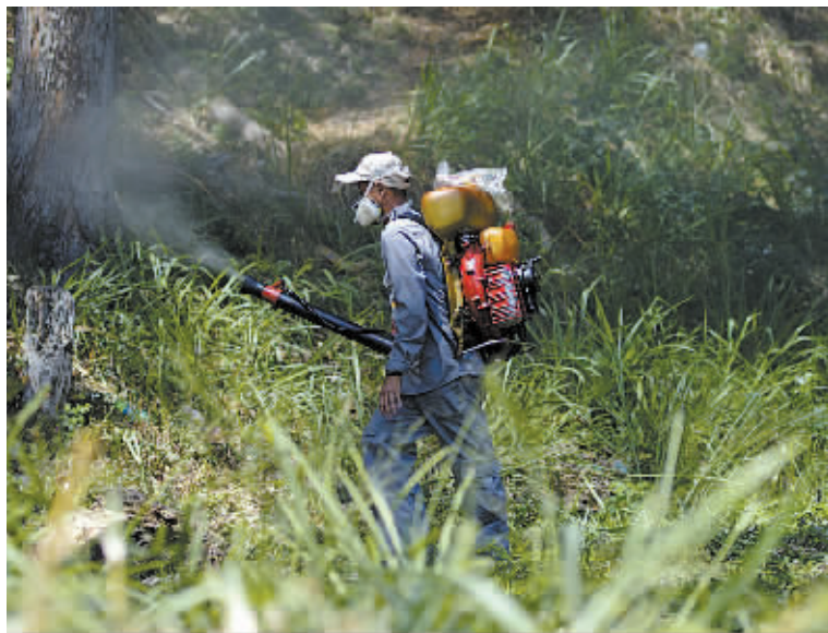
1月28日，在委内瑞拉加拉加斯，一名卫生部门工作人员喷洒灭蚊剂。

陈冯富珍表示，某些地区寨卡病毒的出现与新生儿小头症及格林-巴利综合征病例数量激增存在关系，虽然寨卡病毒感染与出生畸