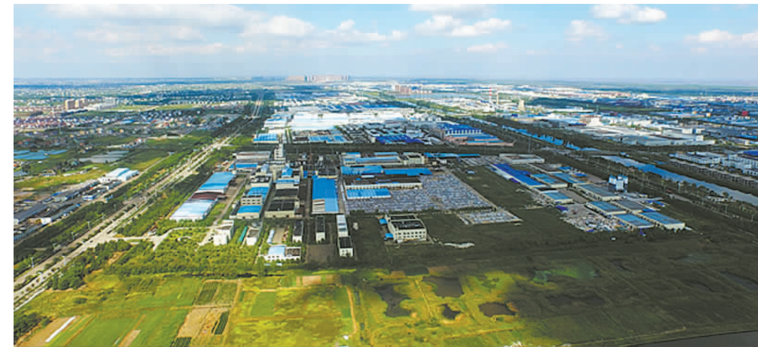
图为高端制造产业园

一方面，要从提高供给质量上下功夫，切实加强产业有效投入。今天的产业投资，决定了明天的产业结构和产品供给，在当前多数行业产能过剩的情况下，新区产业投资要避免在低端领域、传统产业重复叠加，着重瞄准代表新经济、新技术发展方向的先进产业，瞄准适应品质化消费、个性化消费需求的新兴领域。特别要发挥新区的空间优势，重点围绕智能汽车、高性能新材料、生命健康、通用航空等新兴产业，引进一批龙头企业、重大项目，加快重大产业布局，通过培植一批更具市场优势的产业链，避免“一业独大”的市场风险，实现多点开花。招商引资作为产业投资的“头道菜”，也要创新方式、精准制导，紧紧把握全球技术创新潮流和新兴产业动态，实施靶向招商，以持续有效的优质项目供给带