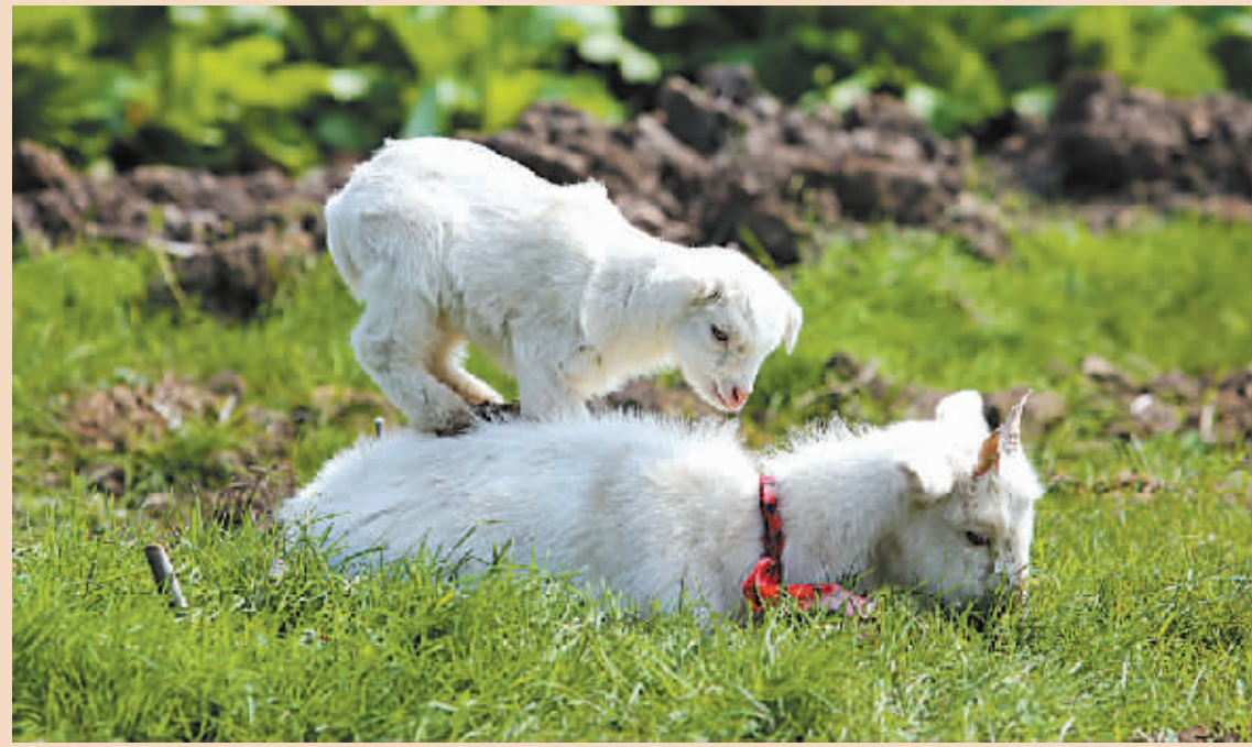
▼ 舐犊情深。