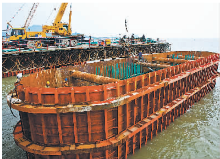
工人们在桥墩承台里进行混凝土浇灌施工。

副总工程师章文彬和来自安徽的班组长唐师傅商量9号桥墩的收尾工作。工人们20人一组,忙着往桥墩承台里浇灌混凝土。章文彬说,浇筑这么一个桥墩,要在相应位置上打上多根100多米长的桩基,再在上面搭建承台进行浇筑,每个桥墩要浇筑900立方米的混凝土。由于浇筑桥墩工艺要求不能间断,而一个桥墩浇筑需要10来个小时,工人只能三班倒。目前,桥墩已经浇筑了7个,节前收工争取完成10个。在第七标段,这样的桥墩总共要浇筑214个。