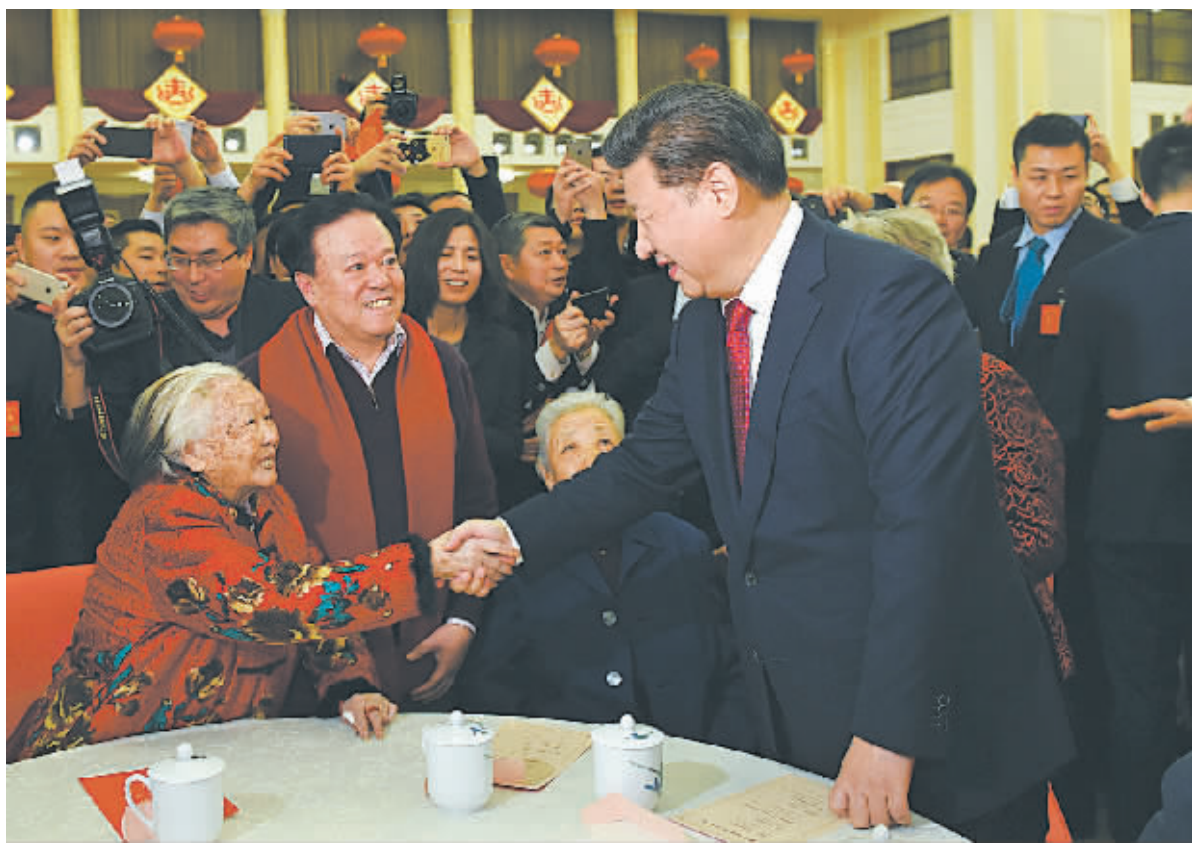
中共中央总书记、国家主席、中央军委主席习近平同首都各界人士亲切握手,互致问候和新春祝福。

李克强指出,过去一年,在以习近平同志为总书记的党中央坚强领导下,我国改革发展的巨轮破浪前行,在全球经济低迷的激流漩涡中保持了中高速增长。持续推进结构性改革,大力实施创新驱动发展战略,结构调整亮点纷呈,大众创业、万众创新蔚然成风,促进了发展新动能加快积累,每天数以万计的新企业注册诞生,全年又有1300多万人走上就业岗位。党和政府更加关注和倾力民生,居民收入与国内生产总值同步增长,社会事业取得新的进步,公平正义的根基更加牢固,人民群众的辛勤劳动有了更多回报。这一年,我们也共同经历了一些重大自然灾害和公共安全事件。这些不幸磨难把我们的心连得