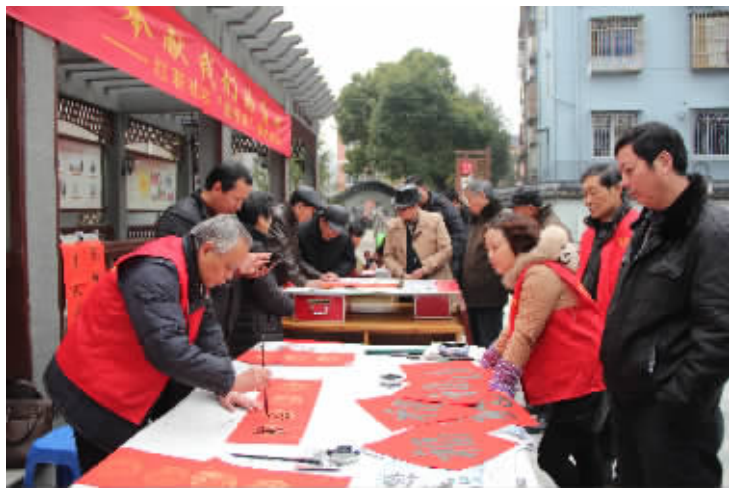
“爱心集市”给居民送上春联