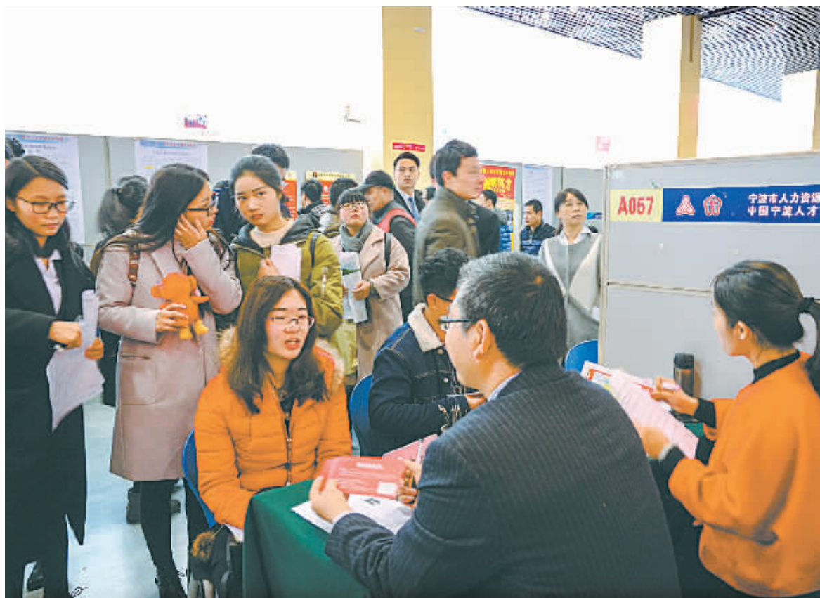
求职者们在人才市场寻觅适合自己的岗位。