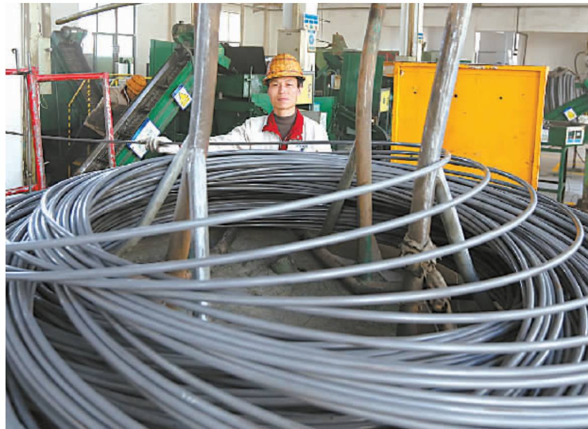
江北一家企业的员工在车间忙碌。

由于市场供求的不平衡，导致目前各行业复合型人才跳槽频繁，如何留住这类高端人才，成为摆在企业面前的一大难题。但用高薪捆绑员工并非一劳永逸，因为总有人出价比你高，培养自己的团队和文化，才是留住复合型人才的最佳办法。