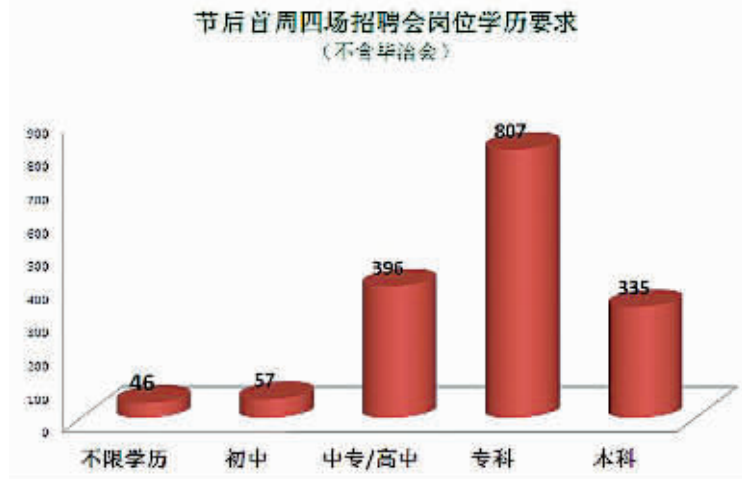
企业招聘要求日渐趋“精”，低学历求职者求职愈显艰难。（周琼 制图）