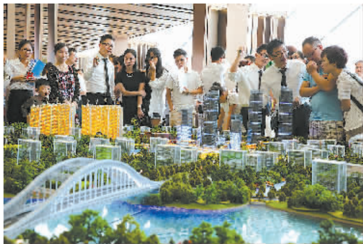
在楼盘销售现场，看房的人多了起来。