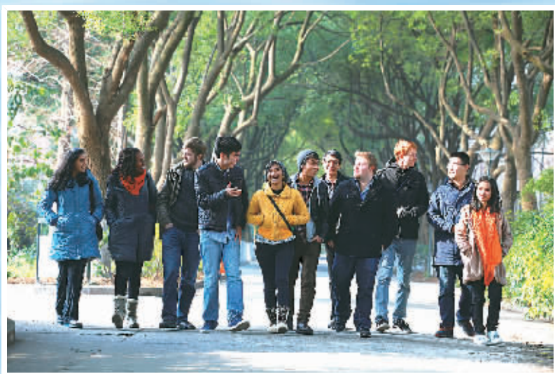
宁大校园里中外学生交流