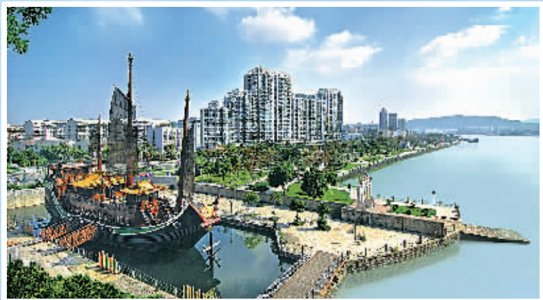
城美沿江大道美景