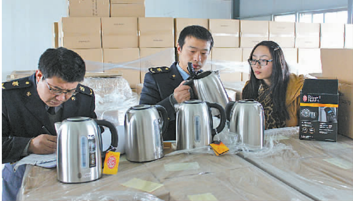
宁波检验检疫工作人员深入一线,帮助企业对产品质量进行把关。

近年来,出于对产品质量、卫生、环保等事关消费者人身健康和安全的考虑,世界各国纷纷出台相应的强制性技术标准和法规加以要求。其中,欧盟、美国、加拿大等发达国家不仅建立了较完善的海关抽查和市场监管机制,而且对于抽查中发现的不合格商品还会公开通报,涉及的商品则面临海关退运、市场召回等。据介绍,美国消费品安全委员会和加拿大卫生部的官网会对北美市场发现的存在安全隐患的消费品进行公开通报,大部分商品会被要求召回维修和免费更换。欧盟则对一般消费品和食品类产品分别建立 RAPEX 通报平台和 RASFF 通报平台,对欧盟各成员国