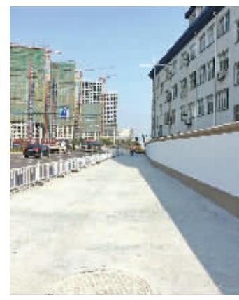
打通的人行道断头处。

记者闻讯来到现场,发现不仅路通了,还补种上了绿化,机动车道与非机动车道中间,还设置了崭新的白色隔离栏。一位经常在这条路上行走的居民说:“以前走在机动车道上,着实心慌,打通后又安全又漂亮,真的要点个赞。”