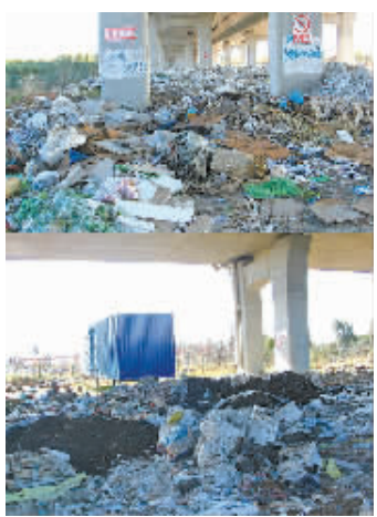
2015年12月,绕城高速镇海段高架下的垃圾。

记者回访看到:垃圾现已清理完毕。道路两旁还围上了简易铁丝网,高架柱子贴上了红色的禁止垃圾倾倒标志。