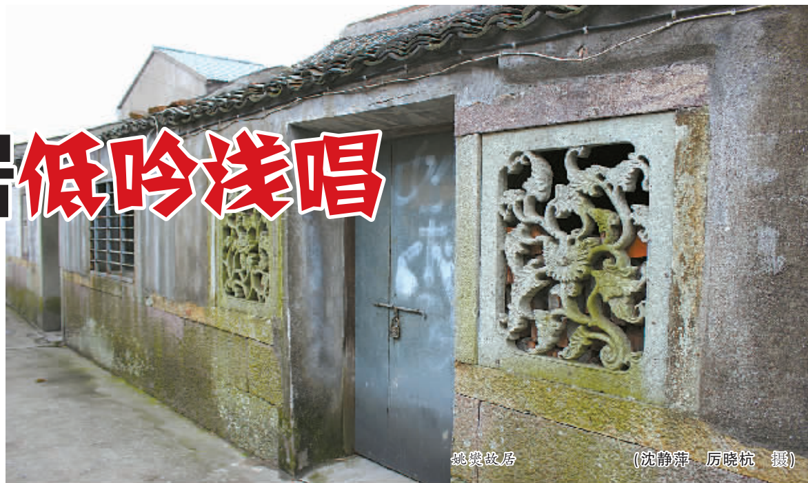
姚燮故居