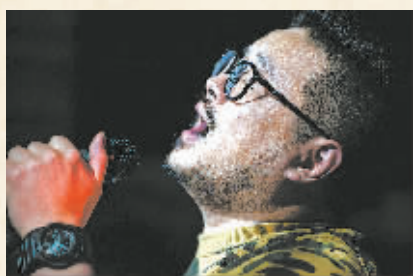
歌手“老逗才”引吭高歌。他说，在这里能将最喜欢的歌与朋友分享。