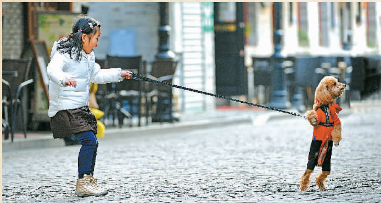
午后的老外滩，小女孩与狗狗尽情戏耍，撒下一地欢笑。