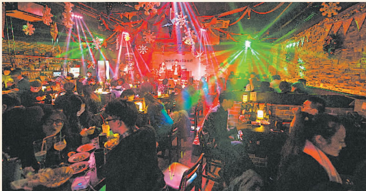
在“左一”酒吧，音符跳动，灯光摇曳。