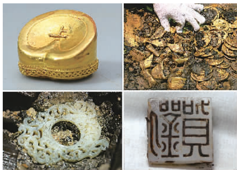
左上图为:海昏侯墓出土的马蹄金;右上图为:海昏侯墓主棺出土的金饼、马蹄金、麟趾金和金板;左下图为:海昏侯墓出土的龙形玉佩;右下图为:海昏侯墓墓主人遗骸腰部位置发现的刻有“刘贺”名字的玉印。

“新发现的玉印是汉代常见的方寸之印,印面简单,仅有‘刘贺’二字,判断为刘贺的私印。”海昏侯墓考古发掘专家组组长、中国秦汉考古学会会长信立祥表示,由于内棺清理工作仍在进行中,不排除继续发现金印的可能。 此外,展览上的可证明墓主身份的珍贵文物资料包括:一枚有着“南海海昏侯臣贺元康三年耐金一斤”字样的墨书金饼,类似的墨书金饼刘贺墓中共出土了4枚;上有“元康四年六月”“南海海昏侯臣贺昧死再拜皇帝陛下”“海昏侯夫人”等字样的秦牍副本照片等。