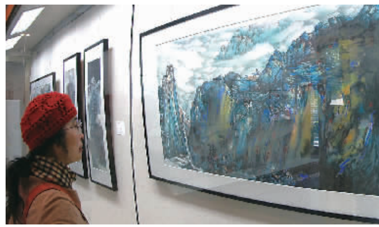
图为,市民在天一阁书画艺术院观赏“真心·山水之间”山水画作品展。