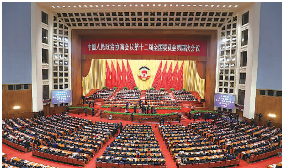
3月3日,中国人民政治协商会议第十二届全国委员会第四次会议在北京人民大会堂开幕。

俞正声从8个方面总结了过去一年人民政协的工作。他说,2015年是全面深化改革的关键之年、全面