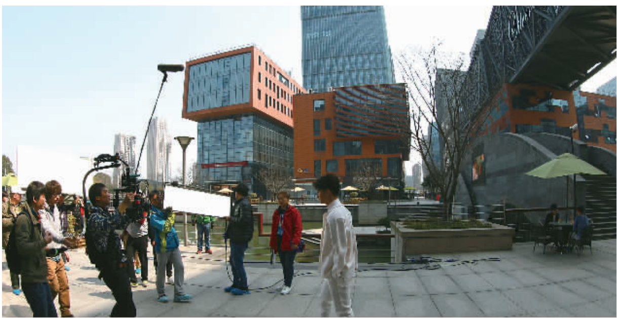
3月2日，电视剧《极品一家人》剧组人员在南部商务区水街拍摄镜头，此剧正式开机。（周建平 摄）

文化产业“风口”下的影视制作业如何在鄞州异军突起？让我们细细搜索其中的成长密码。