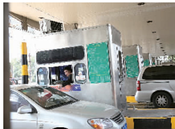
高速出口 ETC 通道 (右图) 和人工通道对比。

随着司机对 ETC 熟悉程度的加深，我市 ETC 车辆快速发展起来。据市公路局收费公路管理处统计，目前我市 ETC 车辆已经超过 15 万辆，较去年一年就增加 6.67 万辆，同比增长了 85%。“货车中，仅国际标准的集装箱车能装载 ETC 设备，全市约三分之二的国际