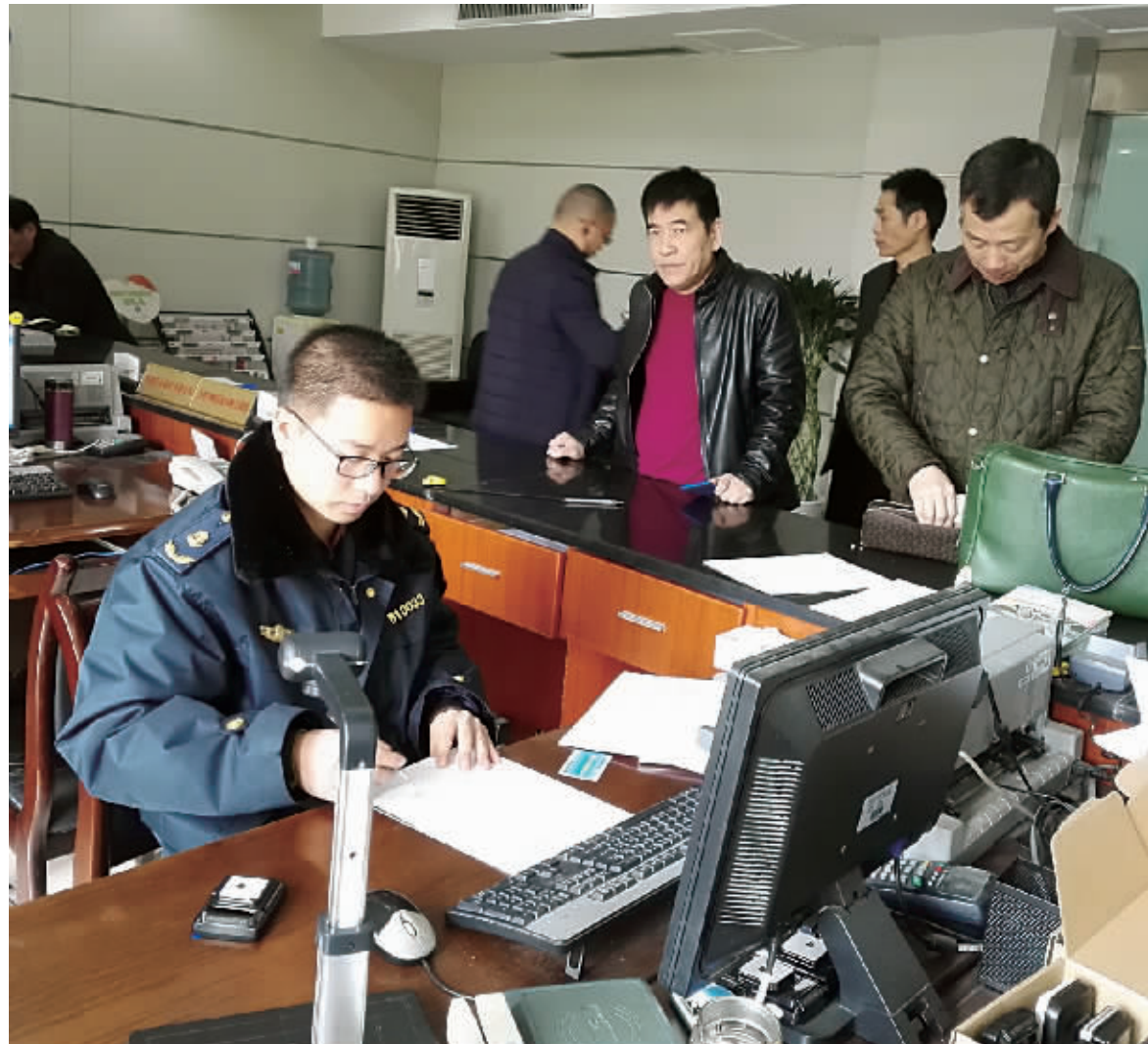
车主在办理 ETC 业务。