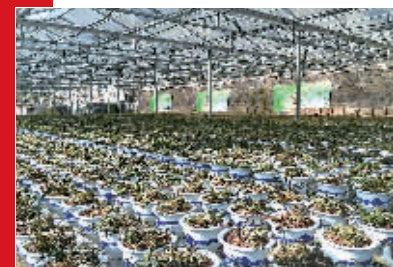
香泉湾铁皮石斛培养基地。