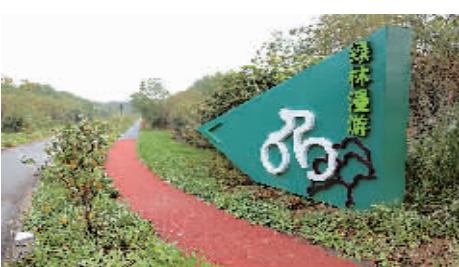
图为村里新修的“绿林漫游”游步道，成为村民休闲健身的好去处。

春风送暖，镇海区庄市街道永旺村“帮帮寻根”精品线生机勃勃，湿地松、香樟黄绿交杂，玉兰吐蕊。走进村里，村道洁净，两旁房屋修葺一新，庭院里摆满绿化，一幅幅乡村新画卷徐徐展开。