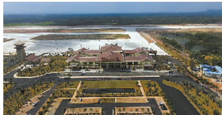
从空中拍摄的博鳌机场。

年3月开工建设，2016年1月完工，用时不到10个月。目前，博鳌机场拥有一条2600米长、45米宽的跑道，2条垂直联络道，25个机位，8.5万平方米站坪，9900平方米航站楼。飞行区等级4C，可起降空客A320、波音B737客机，配套建设通信、导航、气象、供电、供水、供油、消防救援、污水处理等辅助生产设施。