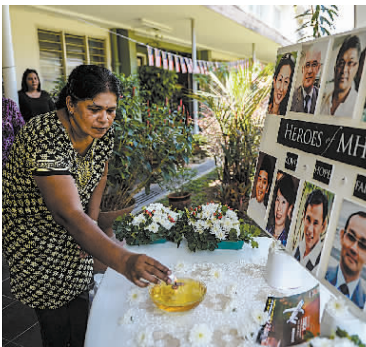
3月8日，在马来西亚必打灵查亚，一名女子点燃蜡烛悼念两年前失踪的马航370航班上的乘客。

2014年3月8日，计划从马来西亚吉隆坡飞往中国北京的马航370航班客机失踪，机上载有239人。2015年1月29日，马来西亚民航局宣布该航班客机失事，同时推定机上所有人员遇难。