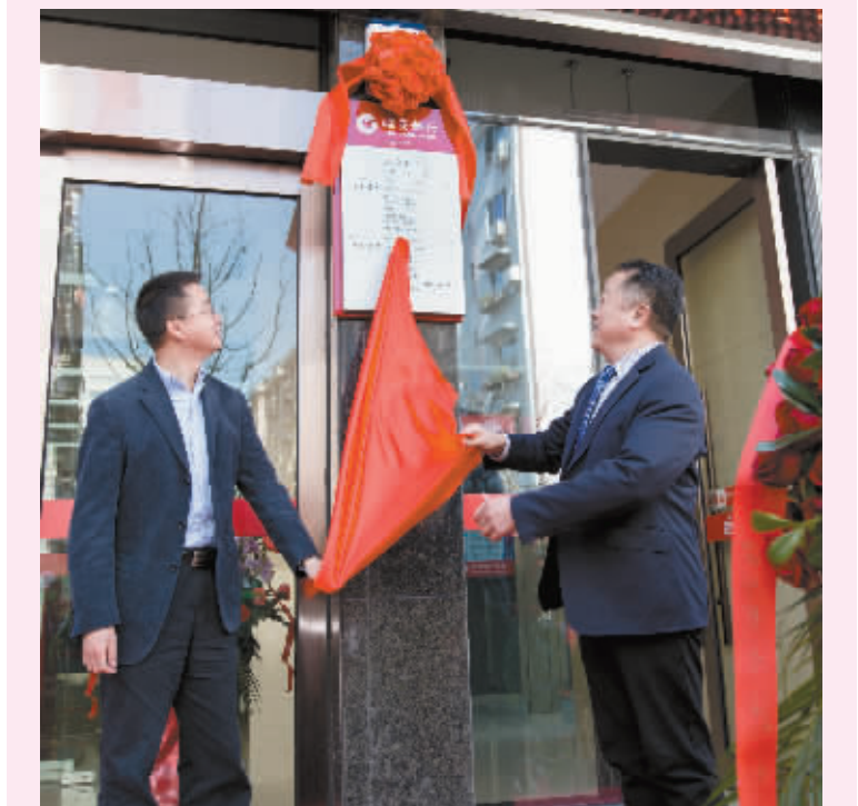
3月4日,临商银行宁波分行喜迁新址,并举行了揭牌仪式。新址位于海曙区厂堂街和创大厦,地处宁波CBD区域,搬迁后的新分行服务功能及设备更加完善,空间更加宽敞,可为客户提供更佳的服务体验。(郑佳艳)