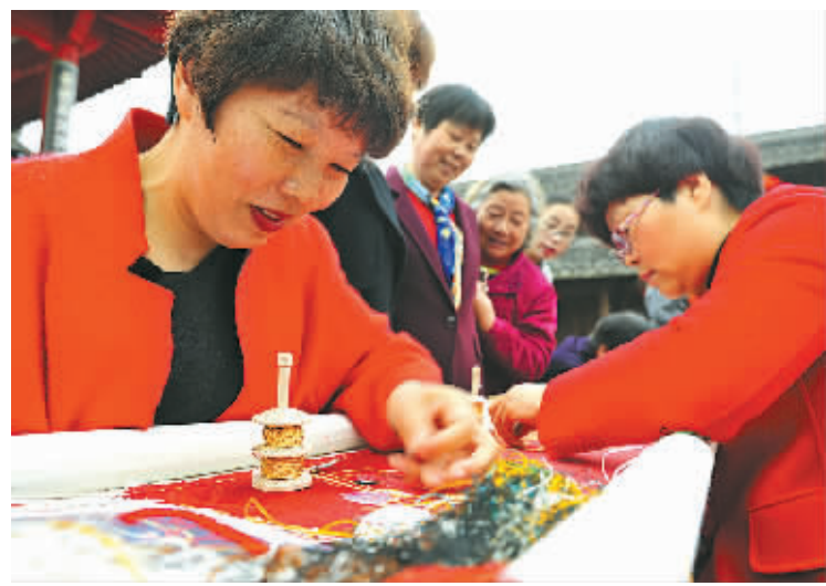
近日,鄞州非遗馆特举行了“金银彩绣传千年经典、双学双比展巾帼风采”活动,非遗馆所在的下应街道来了许多女同志,大家穿针引线比巧手,最后,绣出“金猴捧桃”图案绣品的7号选手一举夺冠。

元培、马叙伦避难福州,扶持张葆灵创办延昌桔园等,世人称颂其“乐善好施”“急公好义”,被誉为慈善家,1933年卒。 纪子庚先生墓约100平方米,是纪子庚与其父母的合葬墓,墓为座椅形“落地龙头式”,四周用块乱石砌成,松柏环抱。墓前耸立有1935年著名教育家蔡元培题词的“纪子庚先生之墓”墓碑,下筑方形合式碑座。墓前一侧有国立北京大学教授马叙伦撰并书900余字的墓志铭。