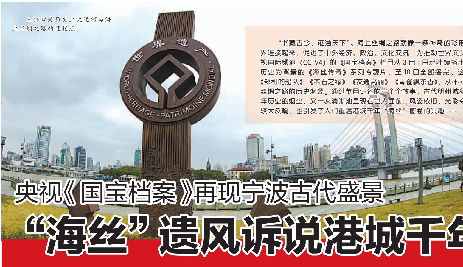
三江口是历史上大运河与海上丝绸之路的连接点。