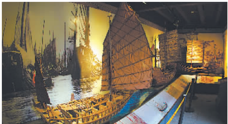
庆安会馆内“明州（宁波）造船业崛起与辉煌”展厅。宁波船为“海上丝绸之路”的拓展发挥了重要作用。

宁波为“海丝”申报世界文化遗产走过了漫长而又艰辛的岁月。目前已有包括宁波、广州、泉州、福州、漳州等在内的9个城市明确加入“海丝”申遗联盟。宁波大学教授、“海丝”研究专家龚雯表示，在这些“海丝”申遗城市中，宁波有一个非常明显的优势，宁波除了是海上丝绸之路的主要始发港之外，还是大运河最南端的出海口，这种通江达海、河海联运的独特地理优势奠定了它的“海丝”地位。此外，宁波的“海丝”研究相比于其他城市要早