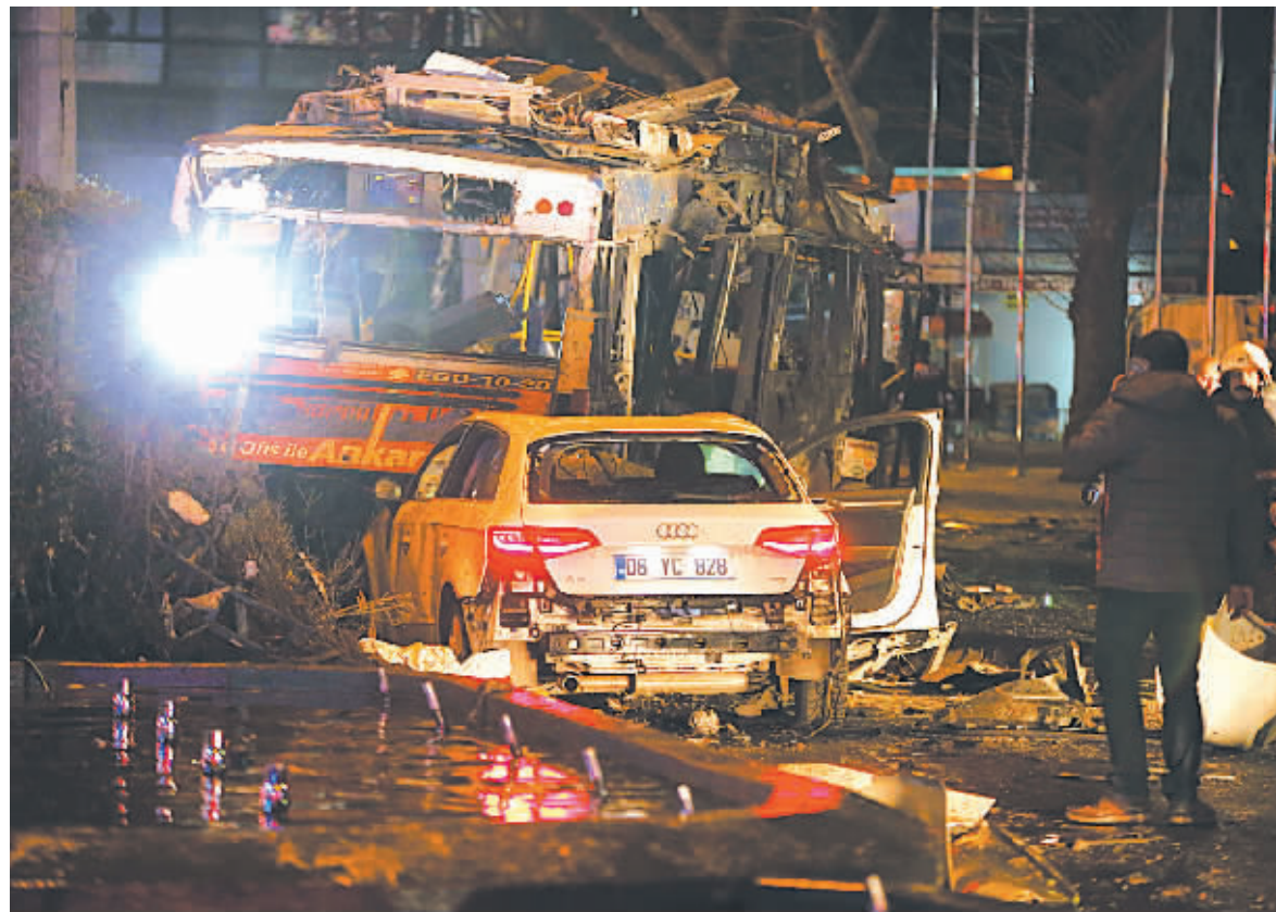
这是3月13日在土耳其首都安卡拉拍摄的爆炸现场被损毁的车辆。

据新华社安卡拉3月14日电(记者郑金发 邹乐)土耳其卫生部米埃津奥卢13日晚说,首都安卡拉市中心汽车炸弹袭击事件死亡人数已升至37人,另有120多人受伤。