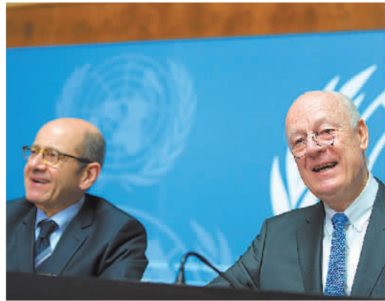
3月14日,在瑞士日内瓦万国宫,联合国秘书长叙利亚问题特使德米斯图拉(右)出席记者会。

核心提示 旷日持久的叙利亚冲突即将进入第六个年头,已经付出了至少25万人死亡、上百万人受伤以及上千万人流离失所的惨痛代价。3月14日,在国际社会努力下,叙利亚政府和反对派代表团抵达瑞士日内瓦,在联合国主导下开始政治解决这一危机的“实质性会谈”。此次“实质性会谈”能否取得实效,国际舆论高度关注。由于叙冲突各方在消除敌意、建立互信方面进展有限,和谈前景不容乐观。