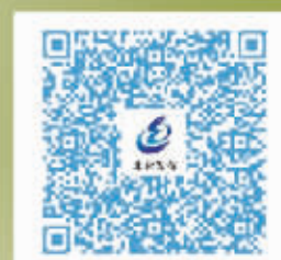
北仑公交换乘全攻略

美丽宁静的梅山湾碧波荡漾，风情各异的北仑“五朵金花”（梅花、牡丹花、玫瑰花、樱花、杜鹃花）陆续绽放。面朝大海、春暖花开，地铁时代的新北仑，热忱欢迎您的到来。