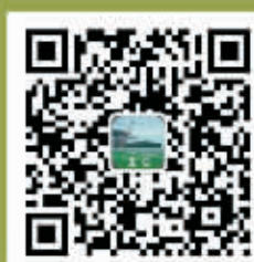
北仑旅游官方公众号