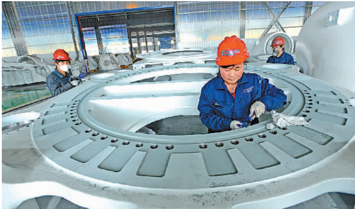
一家企业的技术人员正在对风力发电机轮毂进行出厂前检测。

“近年来市政府一直千方百计为企业减负,不少税费减免了、审批手续少了,但仍有企业实际感觉