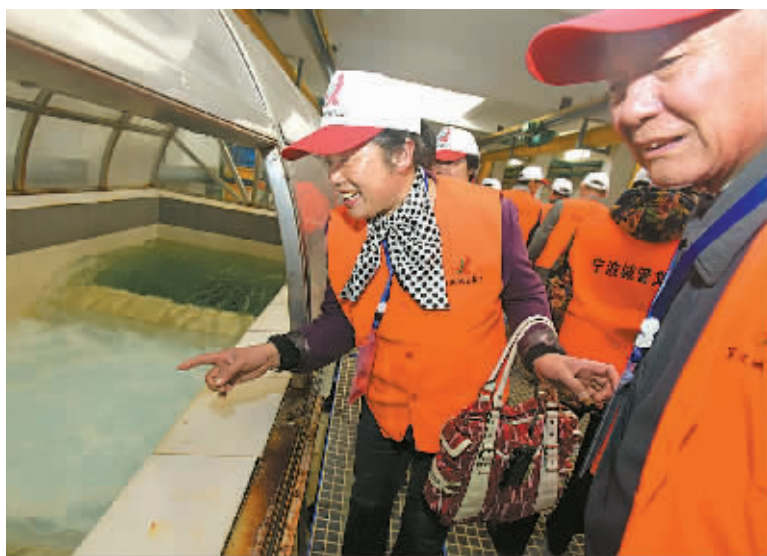
公用事业信息公开是市民的企盼。图为市民应邀参观东钱湖水厂。

正如翁瑞祥所说的，群众最满意的是有效提升了办事便利程度。调查数据显示，“方便群众办事”最受受访者肯定，满意度得分81.0分。而与政府相关的“规范政府行政权力运行”“遏制腐败行为发生”和“提高权力运行透明度”的满意度也分别达到80.5分、80.3分和80.1分。