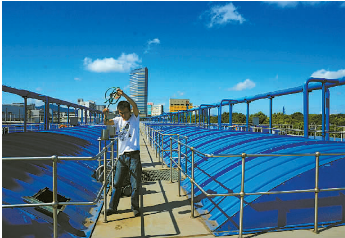
宁波岩东排水有限公司的职工在操作污水处理设施。

北仑小港污水处理厂是此次试点的治污企业,将接纳试点范围内印染、化工等企业的工业废水。目前,企业打算建造若干条处理印染