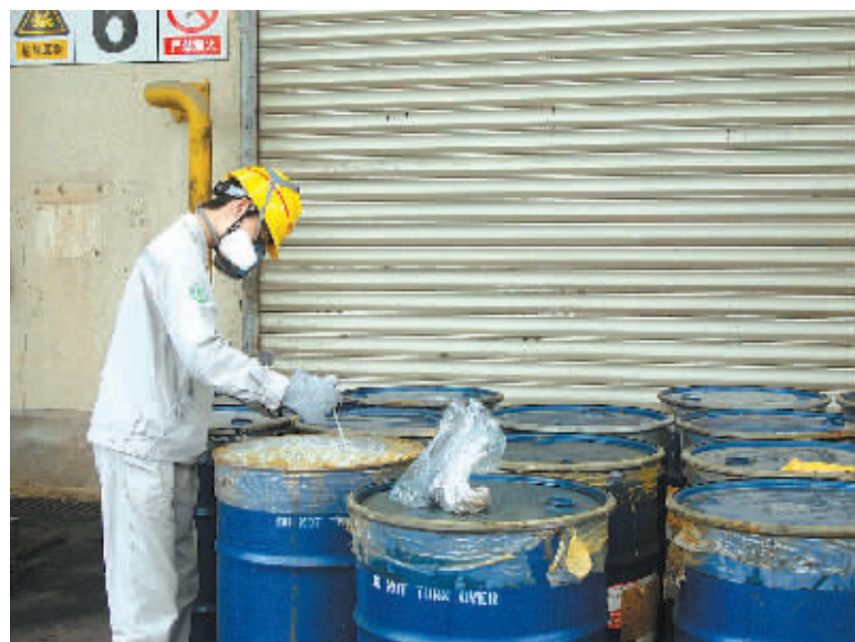
北仑环保固废处置有限公司危废处置现场。

《意见》还提出,推进排污权有偿使用和交易试点,建立排污权有偿使用制度,规范排污权交易市场,鼓励社会资本参与污染减排和排污权交易。