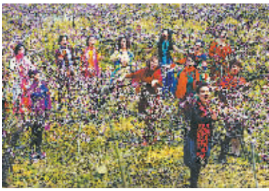
前日，江北文化馆三江宴时茶艺走进奉化桃花源、武林广场等地表演，展现女人的美丽和时尚。图为表演现场。

不过，在关键区域，国足取得了优势。特别是在前场 30 米区域的传球次数已 75:56 明显压倒对方，体现了进攻的压迫性。