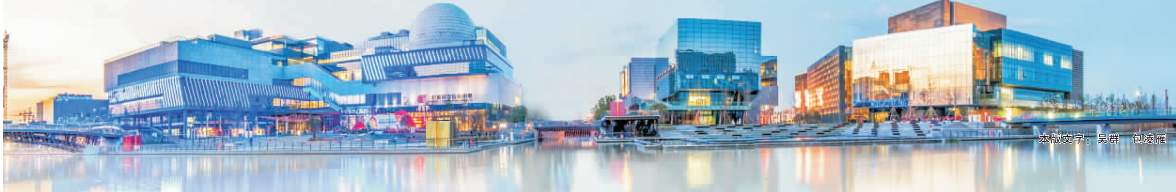
本版文字：吴群 包凌雁

为了记录发展历程，展示国企形象，推动深化改革，宁波市国资协会推出“2015年度宁波市国资系统最具影响力十事评选”活动。活动期间，各家市属国有企业积极发动，广泛宣传，活动反应热烈。据统计，截至3月6日，问卷微信客户端点击量15598，点赞163人次，进入问卷7987人，完成问卷2886人，顶峰时段频次达到1618人/天。