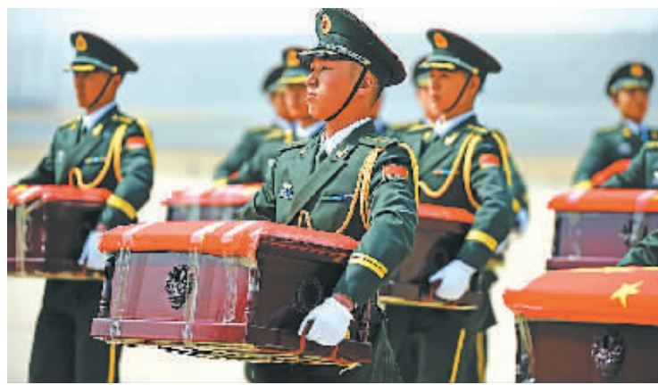
3月31日,在沈阳桃仙机场,礼兵手捧志愿军烈士遗骸棺槨。

据新华社沈阳3月31日电 (记者张玉清 张汨汨)中国空军1架伊尔-76飞机3月31日接运36位志愿军烈士遗骸回国,空军航空兵第一师出动2架歼-11战机护航,用空军特有的方式向志愿军烈士致敬。