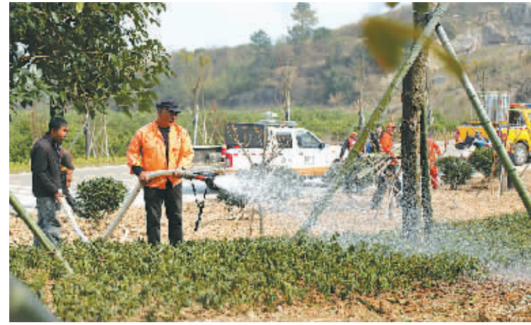
昨天，象山石三线路路高塘岛乡节点景观工程已初显风貌，与村庄、公路和绿油油的田野相映成趣。石三线是高塘岛乡的主要通道，也是前往花岙林的特色旅游通道。从去年 4 月开始，象山公路段打造该路段景观工程，项目总投资 94 万元，预计今年 4 月可全面完工。