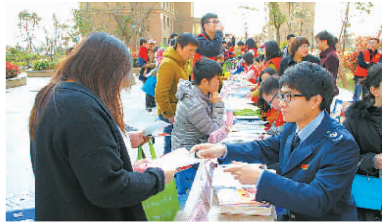
近日，杭州湾新区国税局工作人员走进杭州湾新区世纪社区开展“税收志愿服务进社区”活动，通过发放宣传资料等形式，围绕纳税人关注的供给侧改革、“营改增”、小微企业税收优惠政策等问题，向社区居民进行了深入浅出的讲解，并提供现场咨询服务。