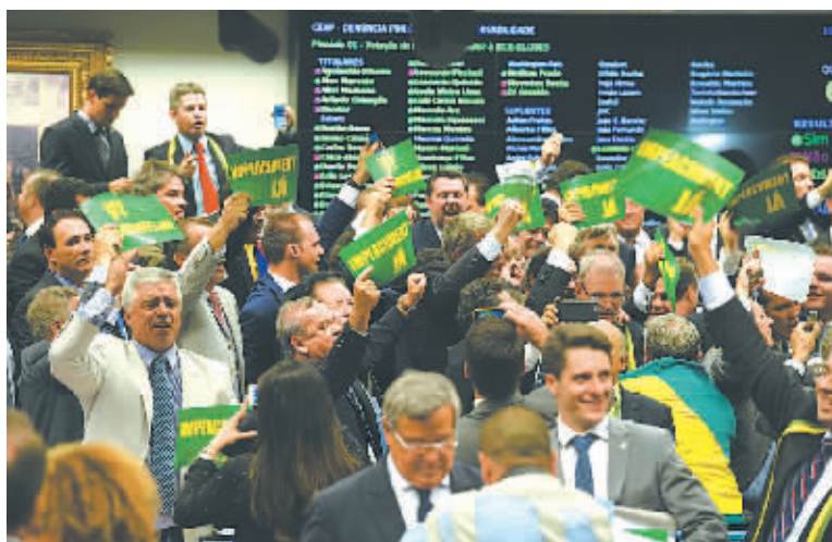
4月11日，在巴西首都巴西利亚，巴西国会众议院特委会成员在投票结果公布之后庆祝。

根据巴西法律，在众议院表决中，弹劾案只有获得513个议席中的至少342席(即三分之二支持率)方可通过。此后，参议院还要对总统弹劾案进行第一轮表决，若弹劾案获得简单多数支持获得通过，总统需离职180天，总统职务由副总统代理；参议院还将进行第二轮表决，若三分之二以上议席支持弹劾，则总统必须下台，由副总统接任。