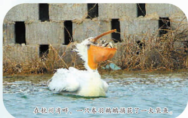
在杭州湾畔，一只卷羽鹈鹕捕获了一大袋鱼。