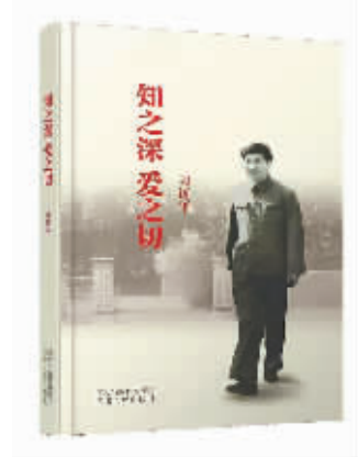
书名 《知之深爱之切》 作者 习近平 出版 河北人民出版社

本书按照“两学一做”活动要求和基本精神，教育引导党员自觉按照党员标准规范言行，进一步坚定理想信念，提高党性觉悟；如何进一步增强政治意识、大局意识、核心意识、看齐意识，坚定正确政治方向；如何进一步树立清风正气，严守政治纪律政治规矩；进一步强化宗旨观念，勇于担当作为，在生产、工作、学习和社会生活中起先锋模范作用等。