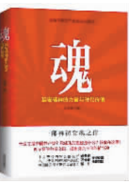
书名 《魂：延安精神的力量与时代价值》 作者 陈燕楠 出版 太白文艺出版社

本书按照“两学一做”学习教育活动要求，针对如何尊崇党章遵守党规为基本要求，坚定理想信念，提高党性觉悟，重点就学习活动中可能出现的热点、疑点、难点问题，采用一问一答的方式进行答疑解惑，为活动提供基本遵循和行动指南。