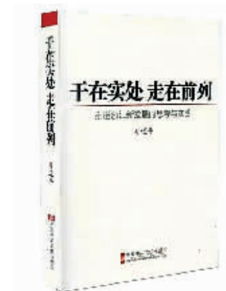
书名 《干在实处走在前列——推进浙江新发展的思考与实践》 作者 习近平 出版 中共中央党校出版社

《知之深爱之切》是习近平同志担任县委书记期间的重要著作，填补了他在地方工作岗位上重要思想和论述的空白。对于中国特色社会主义理论探索研究是有益的推动，对于党史资料挖掘运用是有益的丰富，对于党员干部学习领会习近平总书记系列重要讲话精神是有效的辅导。