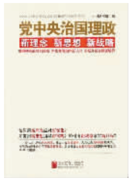
书名 《党中央治国理政新理念新思想新战略》 作者 本书编写组 出版 北京联合出版公司

作者以延安往事为主线，以延安精神的原生形态为重点，回顾了延安时期诸多有哲理、有力量的经典故事、经典文章、经典论断，对党中央在延安13年历史进行了原汁原味的探讨，展现中国共产党人的精、气、神，揭开了中国共产党的成功密码。