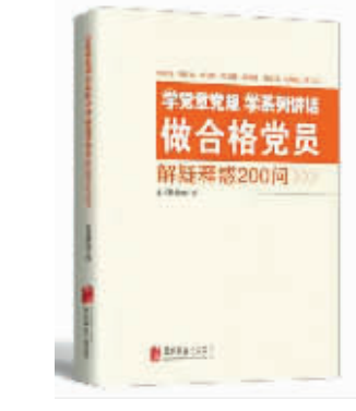
书名 《学党章党规系列讲话 做合格党员 答疑解惑200问》 作者 本书编写组 出版 北京联合出版公司

该书辑录了习近平同志2002年至2006年担任中共浙江省委副书记期间的重要报告、讲话、文章和批示。这些文稿全面反映了习近平同志十六大后对推进浙江新发展的战略思考和实践探索，真实记录了习近平同志在浙江的工作经历和心得体会，系统展现了习近平同志在经济建设、政治建设、文化建设、社会建设、生态建设和党的建设等方面的重要思想。