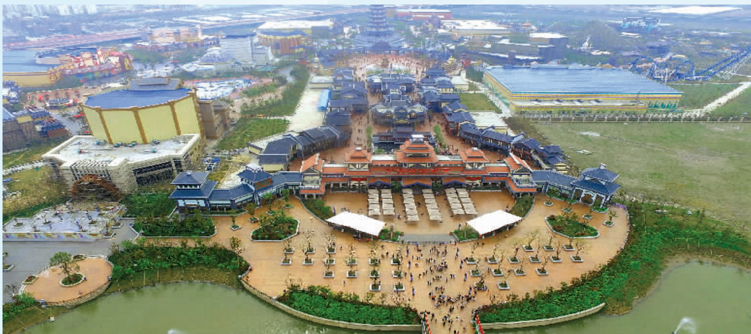
方特东方神画航拍图。

明天，刚刚被评为有中国游艺界奥斯卡之称的“中国最受期待主题乐园奖”的宁波方特东方神画将盛大启幕，宁波杭州湾新区在已有“湿地、温泉”旅游资源基础上又新增一文化旅游金名片。