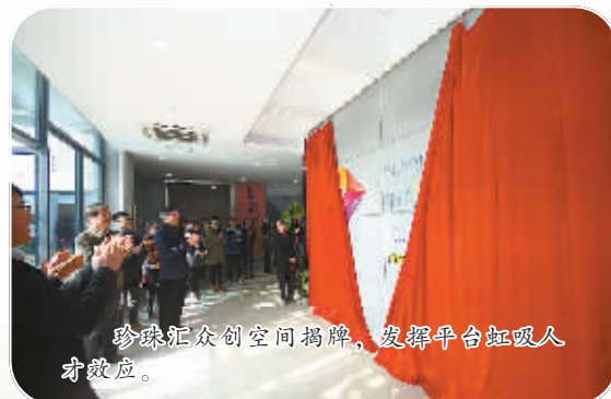
珍珠汇众创空间揭牌,发挥平台虹吸人才效应。