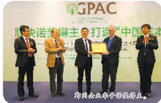
鄞州企业牵手创投领域。

走访制度,深化便捷(Simple)、真诚(Sincerity)、满意(Satisfy)的“3S”高层次人才服务工作法,去年区“两创”服务联盟总窗和专窗共协调办理各类服务事项180多项。开办了“千人计划”创业人才专题培训班,聘任第二批创业导师团11人,举办首期“才·富论坛”。