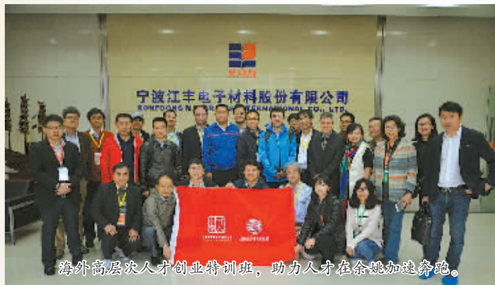
海外高层次人才创业特训班,助力人才在余姚加速奔跑。

2015年,姚城又添英才,人才总量达25.9万人,其中高层次人才4477人,新入选国家“千人计划”3人、省“千人计划”6人、省领军型创新企业团队1个、市“3315计划”团队2个、个人1名,交出了一份骄人的年度答卷。