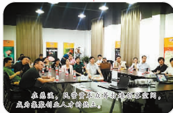
在慈溪,民营资本众筹打造创客空间,成为集聚创业人才的热土。