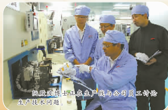
院院博士正在生产线与公司员工讨论生产技术问题。