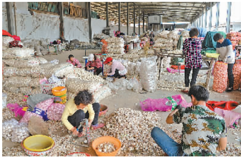
4月13日，在河南省中牟县的一个大型蔬菜批发市场，蒜商在分拣大蒜，批发价格每公斤10元-12元不等。

“世界大蒜看中国，中国大蒜看金乡”。在金乡县缙城路上的南店子大蒜市场，每天都聚集着上百名大蒜经纪人。这里在业内有“大蒜华尔街”之称，全国甚至全世界的大蒜价格都由这里主导。 金乡是全国大蒜的主产区之一，金乡及周边几个县市的大蒜占到了大蒜主产区产量的一半以上，库存量更是超过六成。在这里，“炒大蒜”并不是什么秘密，有时一批蒜在冷库里没动，就被转手了好几次，在“蒜你狠”行情推动下，许多投资者一夜暴富。 “今年投了100万元，差不多挣了100万元。”金乡县马庙镇的蒜商老程说，他只是个小户，一千万元以上的资金才算中等，大户的资金有的过亿元。老程去年存了200吨大蒜，收的时候约5元/公斤，今年的卖出价约12元/公斤，除去每公斤1元多的仓储等费用，差不多每公斤净赚5元。 山东临沂的大蒜投资者孙先