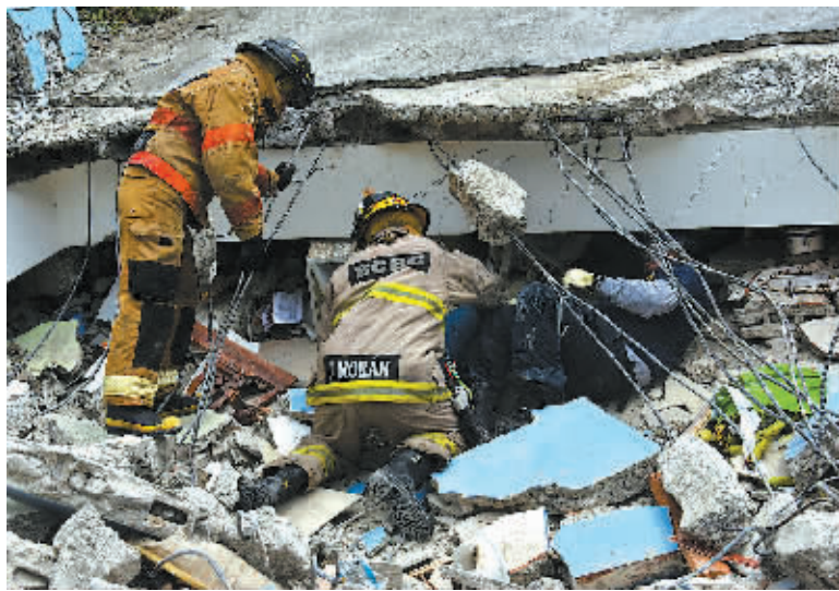
4月17日,在厄瓜多尔瓜亚基尔,救援人员在一座坍塌的大楼中搜索。

“从统计角度看,当前的强震连发态势对我国大陆的地震形势没有明确的短期预测意义。”潘怀文在18日国务院新闻办公室召开的如何看