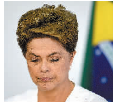
巴西总统罗塞夫的资料照片。

巴西国会众议院17日晚举行投票,以367票赞成通过对总统罗塞夫的弹劾案,弹劾进程将提交参议院审议。分析人士普遍认为,罗塞夫被弹劾的几率大增,巴西政局未来形势不容乐观。目前,已有人呼吁提前举行大选,以解决当前政治危机。