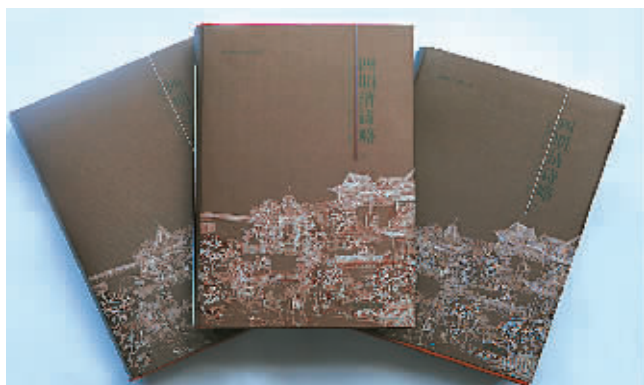
《四明清诗略》

由于时代的推移，四明诗人作品散失极为严重。搜辑前人遗诗，一直是四明学者秉持的优良传统，其中李鄞阳和胡文学合编的《甬上耆旧诗》、全祖望纂辑的《续甬上耆旧诗》是最有分量的两部地方诗歌选辑，但其地域范围主要限于“甬上”一隅。而就所录诗歌规模来说，前者凡得诗家430人、诗3000多首，可借传前30卷。全氏续编，继自明末，截至康熙之际，收甬上诗家700人、古今体诗15900余首、短文近百篇，所录黄宗羲兄弟、魏耕、冯京第诸人，已对胡、李合编所界定的“甬上”地域范围有所突破，而其规模亦远胜之。光绪间，南海潘衍桐辑《两