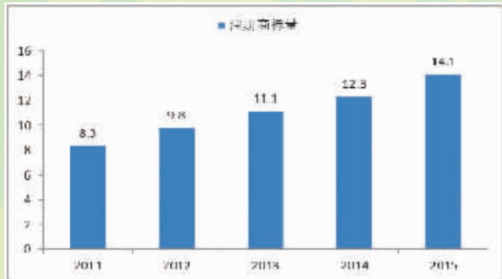
2011年-2015年宁波市注册商标量情况(单位:万件)