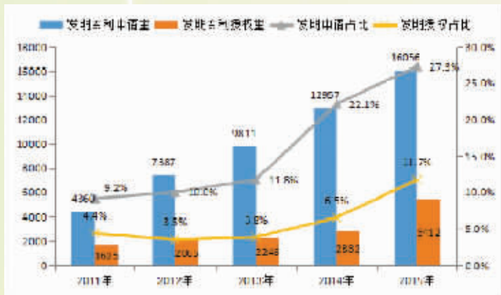
2011年-2015年宁波市发明专利申请授权量及其所占比重(单位:件)