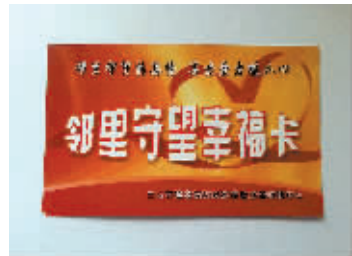
▲▼幸福村“邻里守望幸福卡”