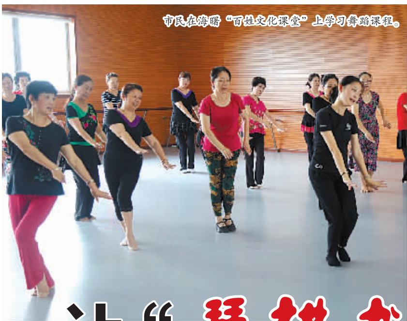
市民在海曙“百姓文化课堂”上学习舞蹈课程。

又到了海曙文化馆“百姓文化课堂”一年一度的开课季，这个连续开办了10多年的公益性课堂又跟往年一样，热闹起来。悠扬的歌声、翩翩的舞姿、高雅的书画等汇聚一堂……让百姓抛开“柴米油盐酱醋茶”的寻常生活、品味着“琴棋书画诗酒花”的文化意境。