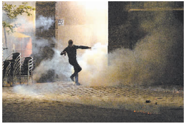
5月10日,在法国南特,抗议政府动用宪法第49条第3款的示威者在与警方的冲突中躲避催泪弹。

据新华社巴黎5月10日电(记者郑斌)法国总理瓦尔斯10日下午在国民议会(议会下院)宣布,决定动用宪法第49条第3款,不经议员讨论和表决,强行通过劳动法修改草案。 本月3日开始,国民议会开始审议劳动法修改草案。这一备受争议的法案引发众多法国民众走上街头抗议示威。另一方面,执政党社会党中的不少议员表示对草案将投反对票。 反对劳动法修改草案的法国“黑夜站立”运动呼吁10日在国民议会前示威,抗议政府动用宪法第49条第3款。 法国左翼重要政治家梅朗雄