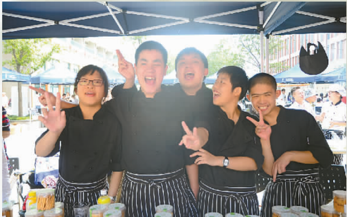
“天使味道”烤出了好吃的点心