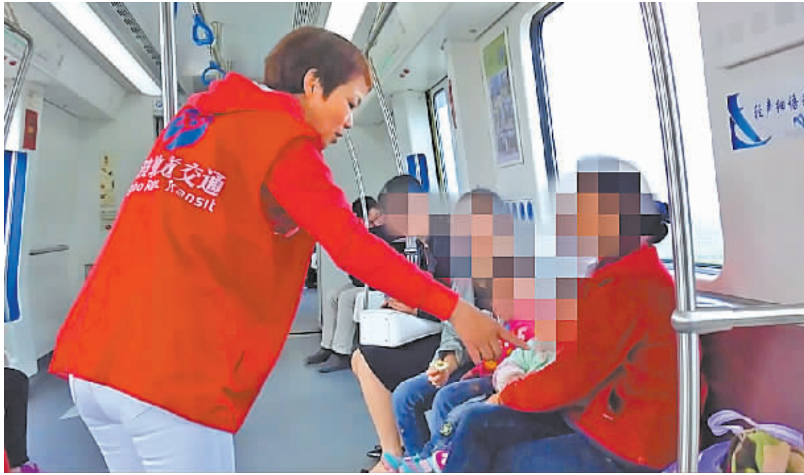
志愿者姜女士在劝导车厢内吃东西的乘客。

网友“开心de宁”：今天乘坐地铁去上班，看到有个女的在车上吃煎饼，两只手油乎乎的，吃相