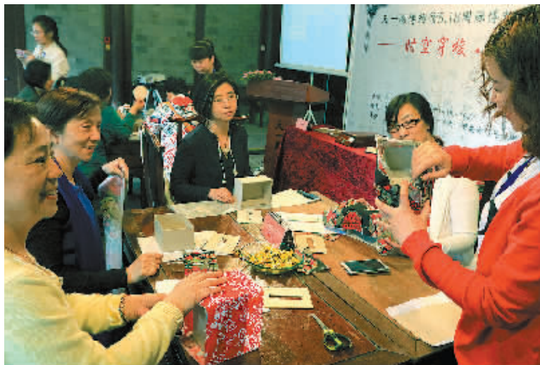
图为昨天，天一阁举行的时空穿梭·我与你“情投艺合”活动上，市民在老师指导下制作艺盒。