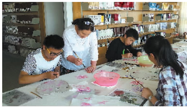
图为澳大利亚籍的吉莉安女士正在向学生示范绘画。

创立于2012年10月的红牡丹书画国际交流社是一个依托宁波大学园区图书馆的公益性文化社团，以中国国花红牡丹为媒，通过向在甬外国友人传授中国书画艺术的形式，致力于对外传播中国传统文化，促进中外文化交流，增进各国人民感情。3年多来，在“红牡丹”里学习过的外籍学员已累计6000余人，这些来自160多个国家的学员包括宁波各大高等院校任教的