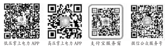
低电压掌上电力APP 高压掌上电力APP 支付宝服务窗 微信公众账号