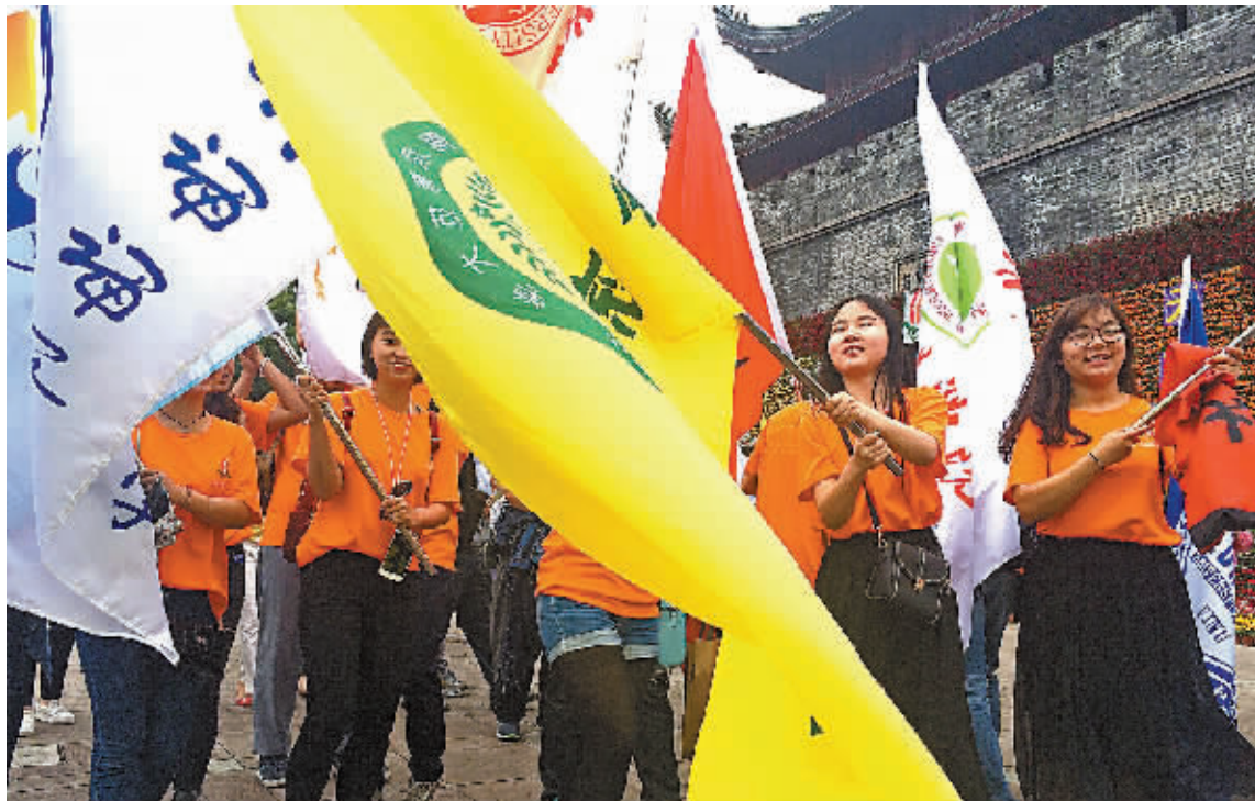
第十四届徐霞客开游节开幕式暨“为中国加分”浙江省文明旅游公益行动启动仪式后,百所高校大学生代表开始“重走霞客古道体验行”。

作为《徐霞客游记》的开篇地,宁海自2002年以来,已成功举办十三届徐霞客开游节,并首倡发起了“徐霞客游线”申报世界线性文化遗产活动。今年开游节期间,宁海还将联合徐霞客游线上的节点城市,继续推动徐霞客游线申报世界线性文化遗产。同时举办中华诗词高峰论坛、“读万卷书,行万里路”百所高校大学生寻访徐霞客足迹等一系列文化旅游活动。