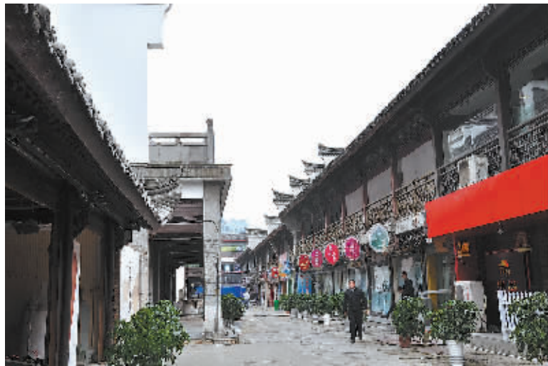
城隍庙周边区域将修缮一新。