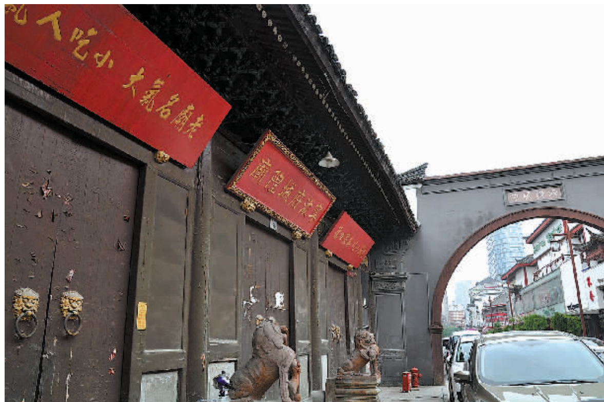
宁波府城隍庙等待修缮。