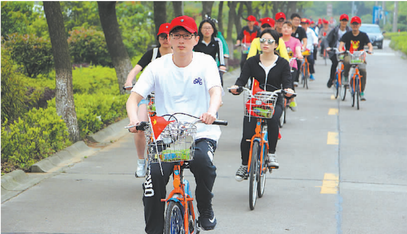
环保人士在苏湖一带骑行公共自行车。