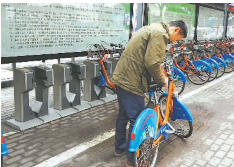
市民在租用公共自行车时调整坐垫。

“每天早上从家门口的宁波四中网点借车，有时候骑到倪家堰地铁口，有时候直接骑到公司，真的