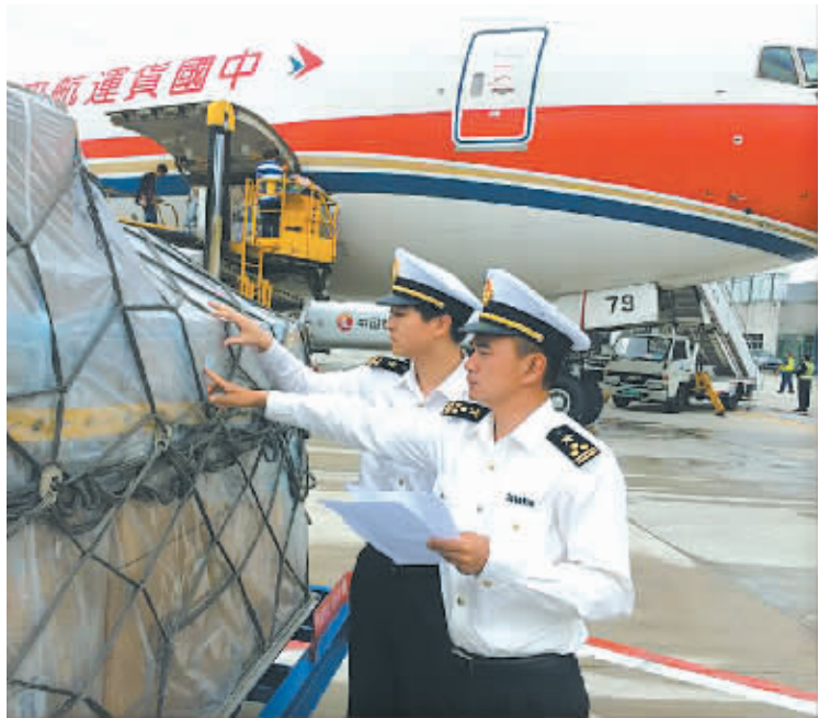
今年以来,宁波空港加快引入国际全货机航线,优化跨境电商物流渠道。图为扬子江航空开通的日本大阪-宁波全货机运载着4吨尿不湿等进口货物抵达宁波栎社国际机场,宁波海关人员在现场监管。

此前,财政部等部委发布通知称,4月8日起实施跨境电子商务零售进口税收政策,并同步调整行邮税政策。据有关人士介绍,新政的最大变化有两点:一是跨境电商由备案制转为提供通关单,这让跨境电商监管回到了一般贸易的监管中;二是对超出限额商品,税改前按个人物品征收行邮税,税改后要求改走一般贸易货物形式报关进口。新政实施后,跨境电商进口交易额短期内大幅下降。来自宁波保税区的消息,跨境电商日成交量下降了80%左右。“从新政推出到现在,一个多月的时间,我们日成交量从每天四五千单下降至不到1000单,所有商品的销量几乎被腰斩。”丫丫趣购副总经理黄辉说。同时,由于正面清单中部分商品在归类上不够明确,这让企业无所适从。“很多商品理论上