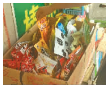
在孙文英小学边上的小店里，一大箱“五毛零食”正等待孩子们的来临。

网友“夕阳的嘴角”：偶然间在小女的书包里发现了几包零食。这些零食包装印刷粗糙，生产日期不明，经询问都是放学后从学校旁边的小商店买的。