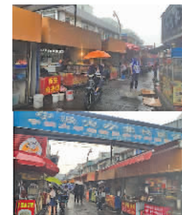
宁大步行街内无证小摊何时整治？