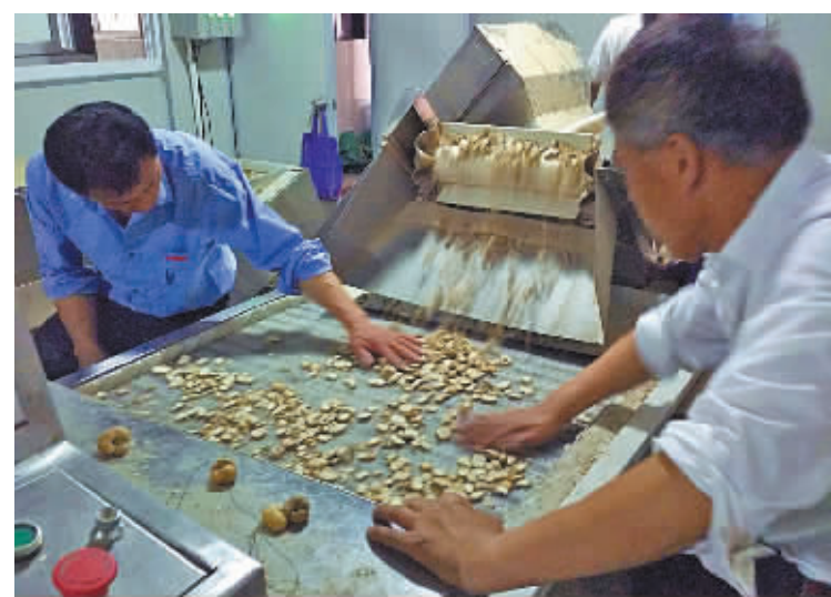
村民正在自动化设备上进行切片烘干。

眼下正是贝母收获季节。网友“颖之星语”最近在鄞州章水镇看到，贝农所晒的贝母外面裹了一层厚厚的粉末，不由疑窦丛生：明令禁止的硫磺熏蒸法难道还在使用？浙贝母如今是怎样加工处理的？