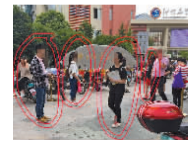
鄞州钟公庙中心小学门口，不少人忙着发传单。