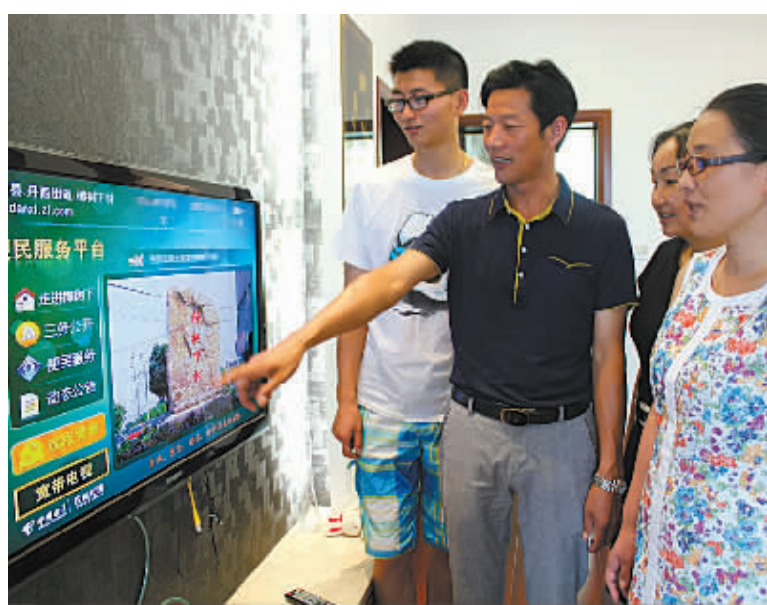
象山：足不出户监督村务