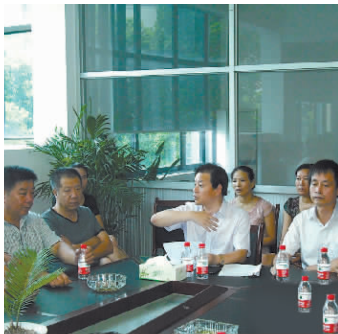
慈溪：村民代表讨论村务

今年年初，象山县对全县490个村的农村基层权力运行情况进行了全面“体检”，并针对检查中发现的问题专门制定了《关于进一步推进农村基层权力规范运行工作的若干意见》，重点推出完善管理防控机制、构建多维监督机制、健全考评奖惩机制等“三项机制”，推动农村基层权力规范运行。