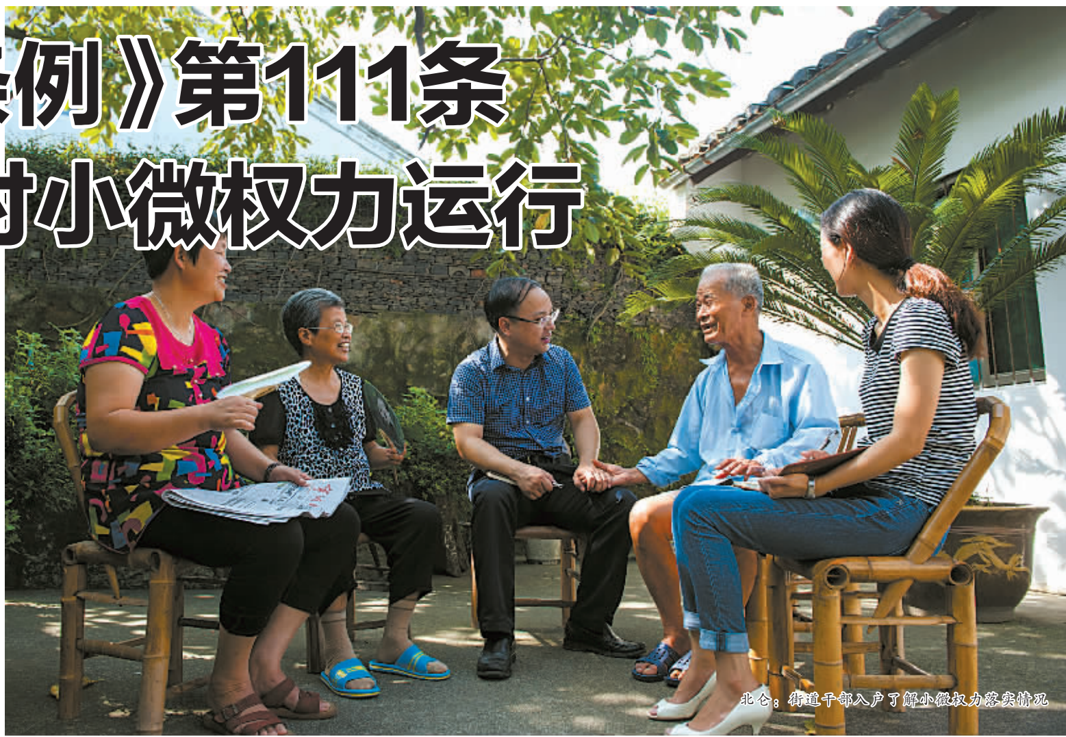
北仑：街道干部入户了解小微权力落实情况